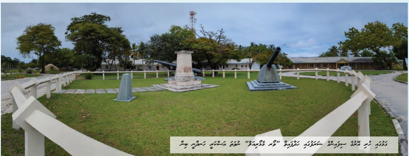
The Midway Memorial, located on Midway Island, commemorates the Battle of Midway. The monument is a large, light-colored stone structure that stands on a grassy area. Behind it, there are several cannons mounted on concrete bases. The background shows some buildings and trees under a clear sky.

The Battle of Midway was a decisive naval battle in the Pacific Ocean during World War II. It took place on June 4-5, 1942, between the United States Navy and the Imperial Japanese Navy. The battle resulted in a major American victory, which turned the tide of the war in the Pacific. The US Navy destroyed four Japanese aircraft carriers, while losing only one aircraft carrier. This victory prevented Japan from capturing Midway Island and other key positions in the Pacific, and it marked the end of Japanese expansion in the region.