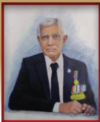
د. محمد (م.ع.ع.ع.) رئيس جامعة القاهرة

”تَمَّ بِرَأْسِهِ عَمَلٌ عَظِيمٌ فِي تَرْبِيَةِ أُمَّةٍ عَظِيمَةٍ وَأَمَّا فِي تَرْبِيَةِ رَأْسِهِ فَهِيَ عَمَلٌ عَظِيمٌ فِي تَرْبِيَةِ أُمَّةٍ عَظِيمَةٍ“