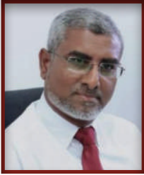
پروفیسر شہزاد حیدر